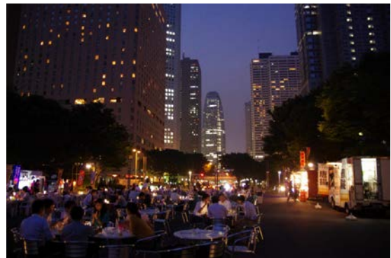
昨年の状況(ナイアガラの滝前の様子)