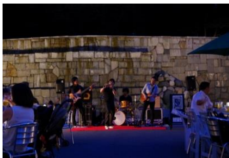
ライブの様子（ナイアガラの滝前）

全国で活躍中のニュー・ジャズ・バンド『JaJa』が登場！感動のライブをお楽しみ下さい。