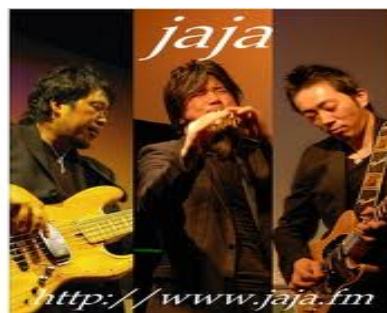
ライブ告知イメージ（JaJa）

★7月28日（月）、8月1日（金）、8日（金）、22日（金）17:30～・19:00～