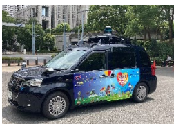
実際走行する自動運転車