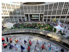
よさこいの様子(昨年実施)