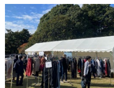
衣類の交換会(イメージ)